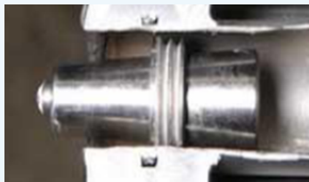
Hydraulic activated plug